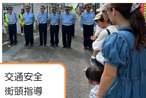
交通安全 街頭指導